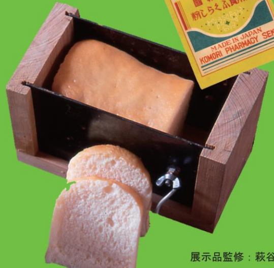
展示品監修：萩谷茂行